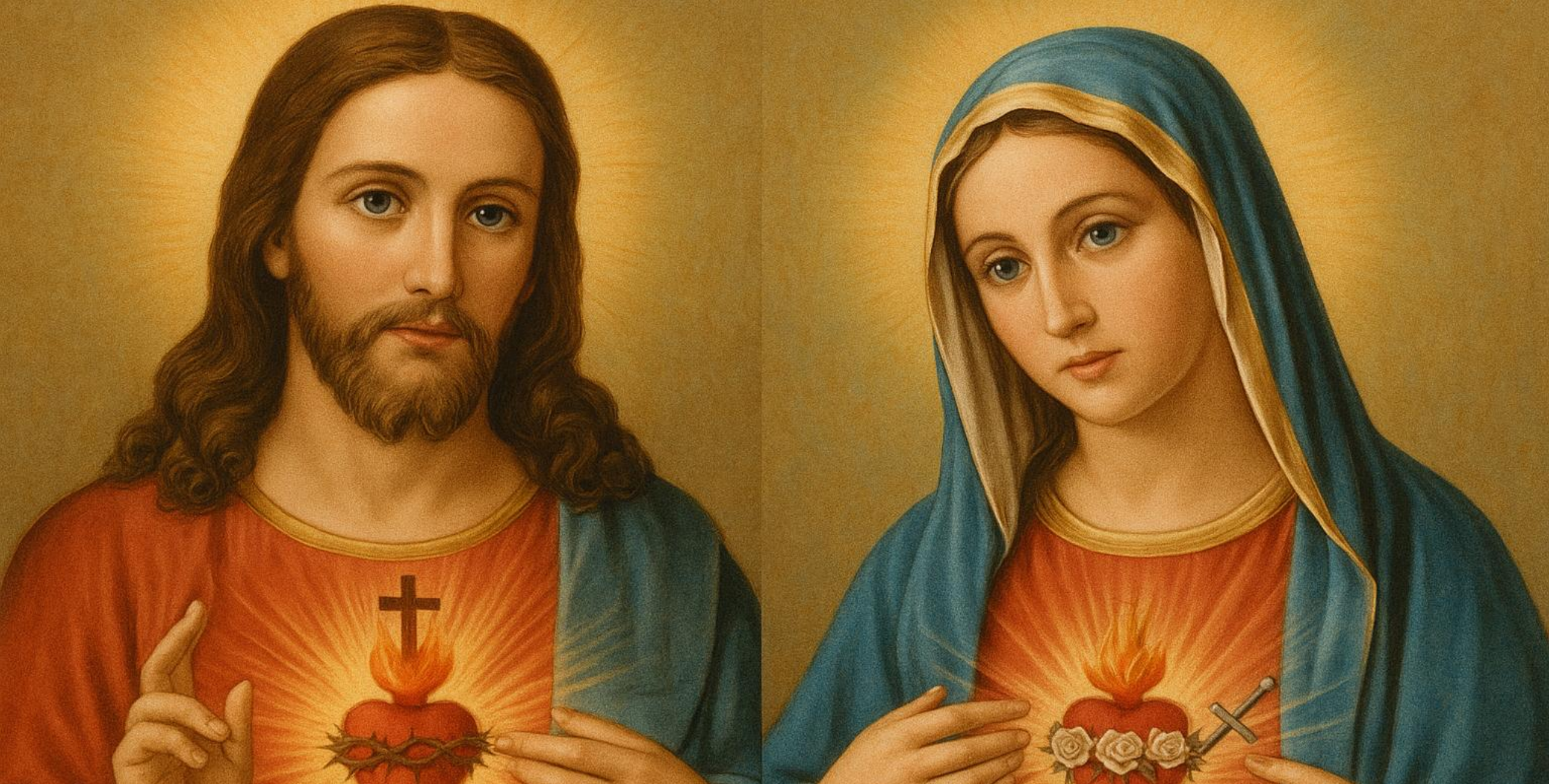
El Sagrado Corazón de Jesús y el Inmaculado Corazón de María Dos corazones, un mismo amor