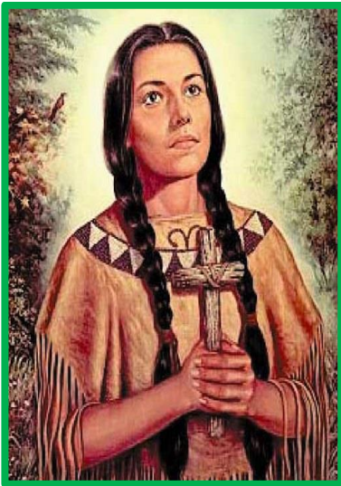
Santa Catalina Tekakwhita