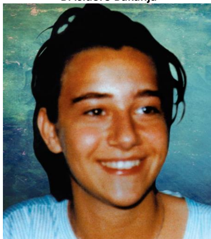
Beata Chiara Badano