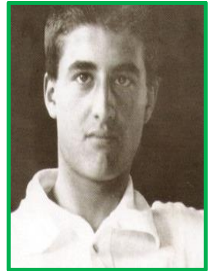
B. Pier G. Frassati