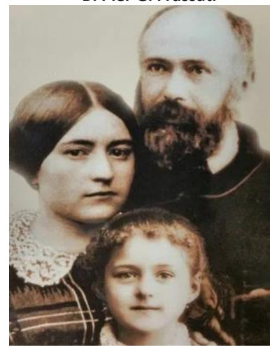
S. Celia Guerin y san Luis Martin